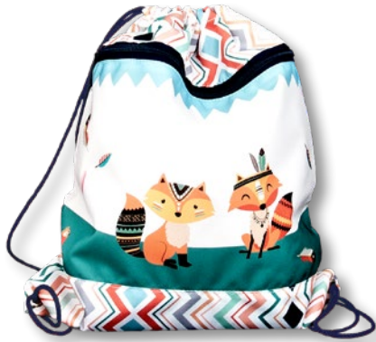
6030.024 Indian Foxes