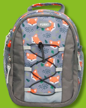
6022.009 Little Fox