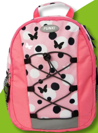
6022.003 Pink Butterfly