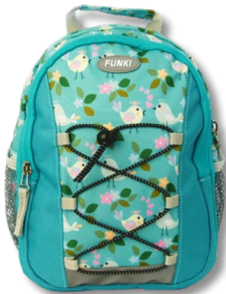
6022.002 Birds in Love