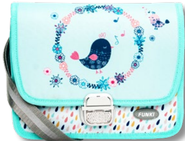
6020.029 Singing Bird