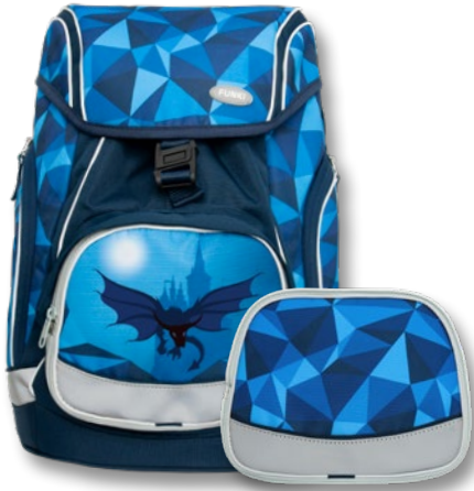
6040.610 Dragon World