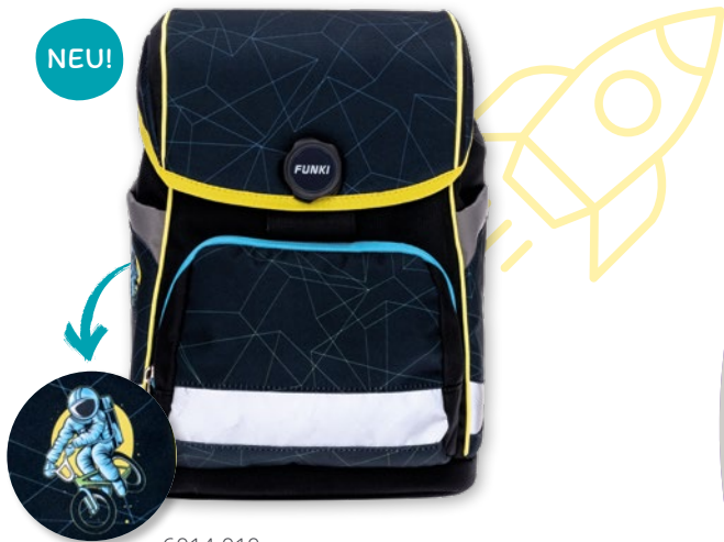
6014.010 Moon Rider