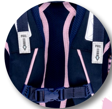
Ergonomisch geformter Rücken

Erhältlich im vierteiligen Set – bestehend aus Schüleretui, Turnsack und Rundbeutel.