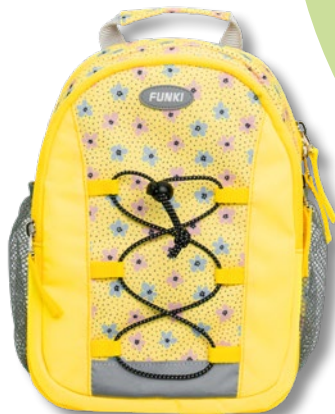
6022.008 Flower Power