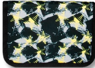
6012.605 Yellow Stars