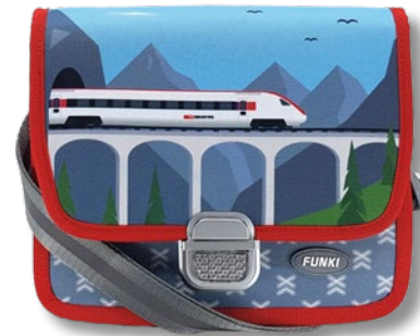
S6020.003 Fast Train