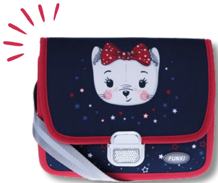
6020.031 Cute Cat