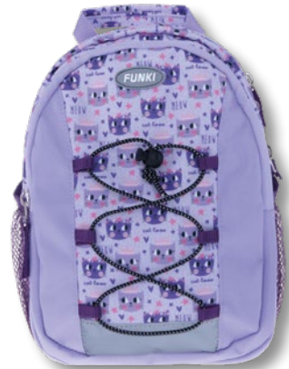
6022.015 Cat Love