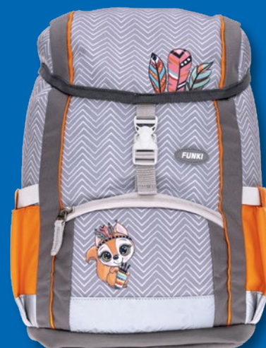
6025.003 Happy Squirrel