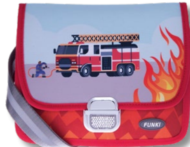
6020.034 Fire Alarm