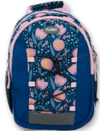
6022.018 Lovely Flowers