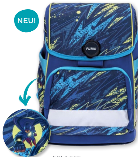
6014.008 Flash Hero