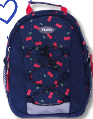
6022.014 Red Cherries