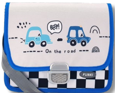
6020.039 On the Road