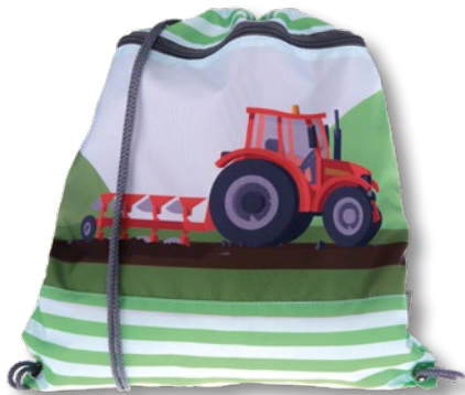
6030.035 Red Tractor