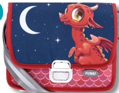
6020.040 Ruby Dragon