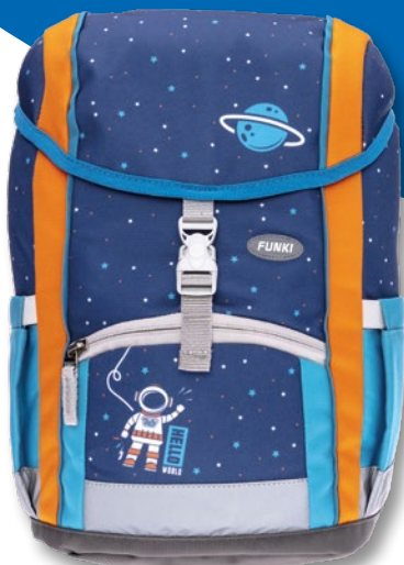
6025.004 Space Mission