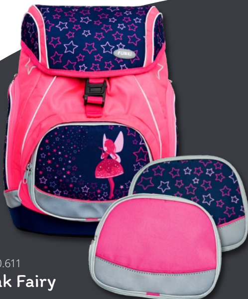
6040.611 Pink Fairy