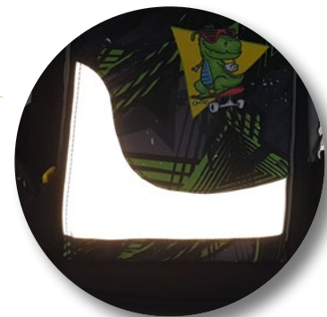
Hohe Sichtbarkeit durch umlaufende Reflexbänder