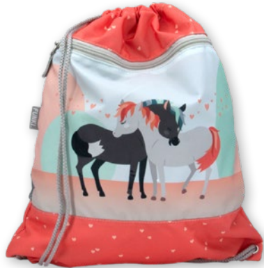
6030.036 Horses in Love