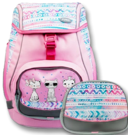
6040.602 Cool Cats