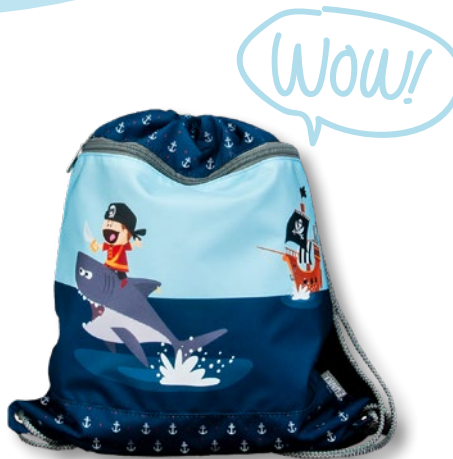
6030.022 Little Pirate