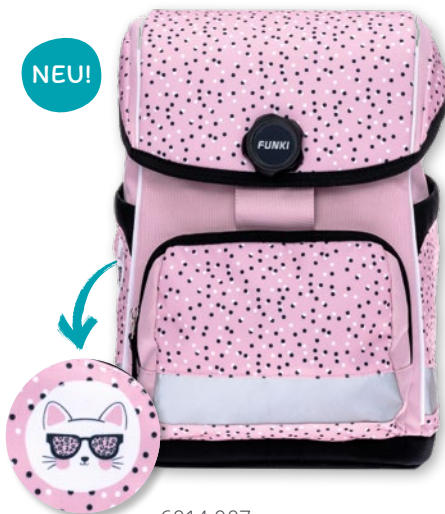
6014.007 Pink Cat