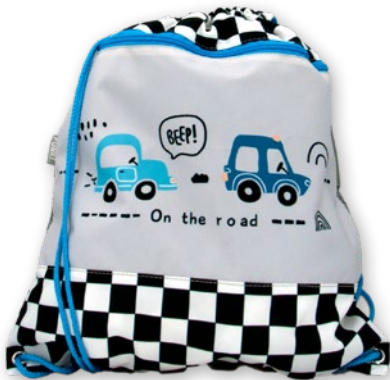
6030.039 On the Road