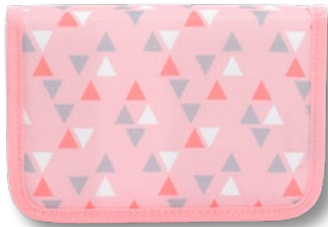
6012.002 Pink Triangle