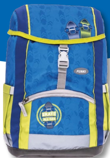
6025.005 Cool Skater