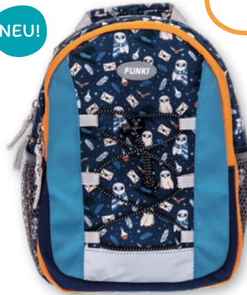
6022.019 Magic Owl