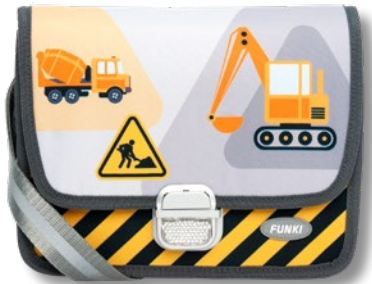
6020.027 Under Construction