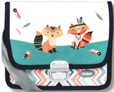
6020.024 Indian Foxes