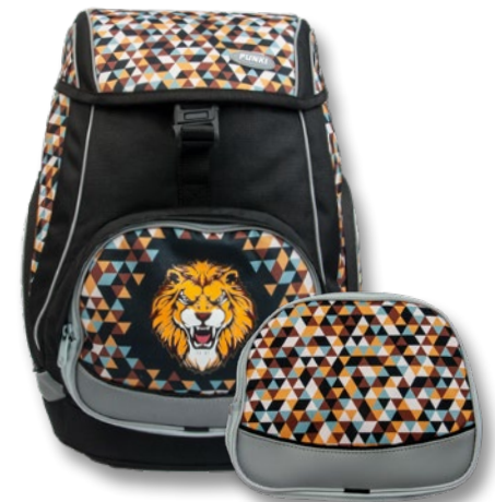
6040.604 Wild Lion