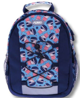
6022.012 Pirate Bear