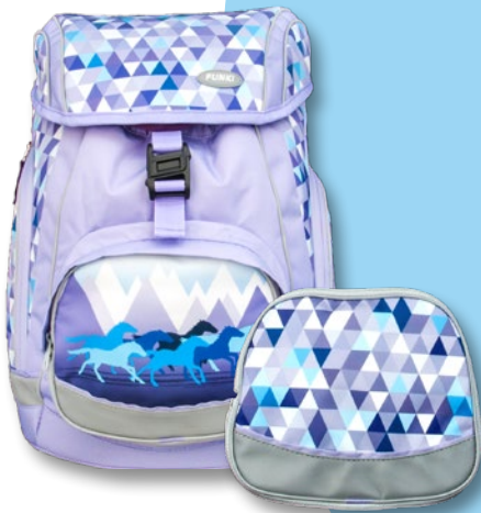
6040.607 Wild Horses