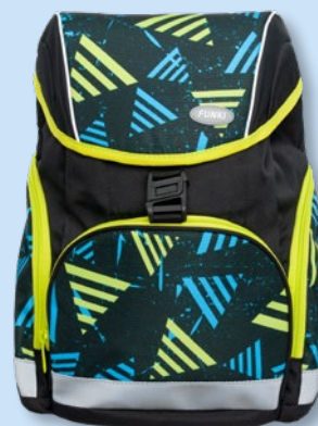
6013.005 Striped Triangles