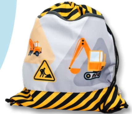
6030.027 Under Construction