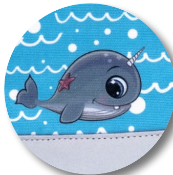
Mit Print auf der Fronttasche

Der sportliche Schnitt und die grafischen, eher neutralen Motive machen lange Freude. Wer's ganz neutral mag, findet in den Mono-Farbvarianten einen schlichten und dennoch fröhlich kinderbunten Rucksack!