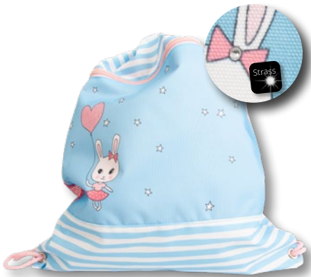
6030.015 Sweet Bunny