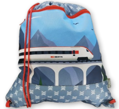
S6030.003 Fast Train