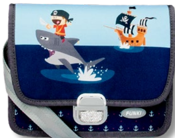
6020.022 Little Pirate