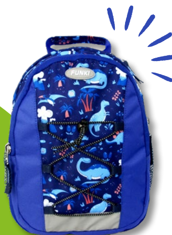
6022.005 Dino World