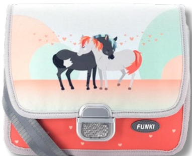
6020.036 Horses in Love