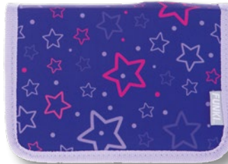
6012.008 Purple Stars