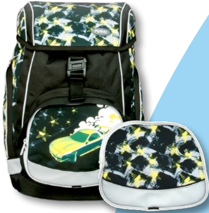
6040.605 Fast Car