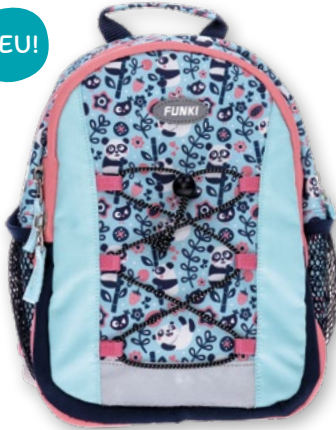
6022.020 Happy Panda