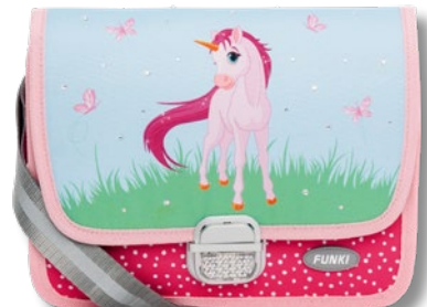
6020.026 Pink Unicorn