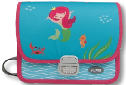
6020.020 Little Mermaid