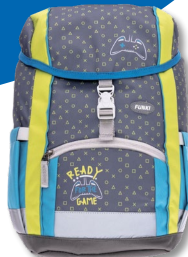
6025.006 Top Gamer