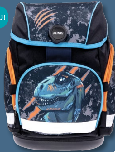
6011.522 Blue Dinosaur