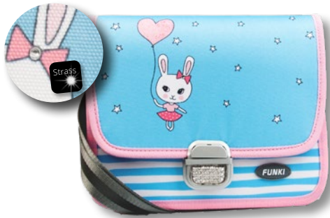
6020.015 Sweet Bunny