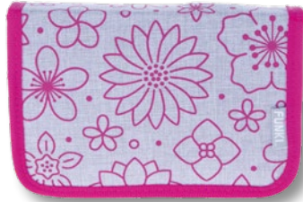
6012.007 Pink Flowers