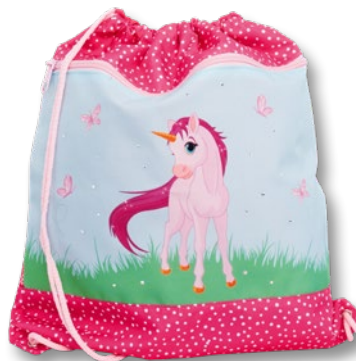
6030.026 Pink Unicorn