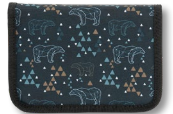
6012.004 Polar Bear