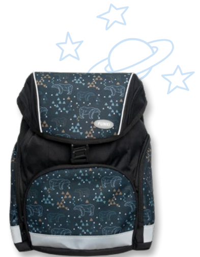
6013.004 Polar Bear