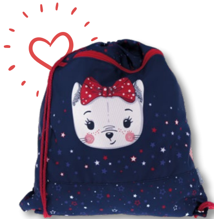
6030.031 Cute Cat