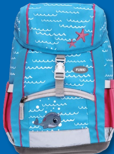
6025.002 Funny Whale