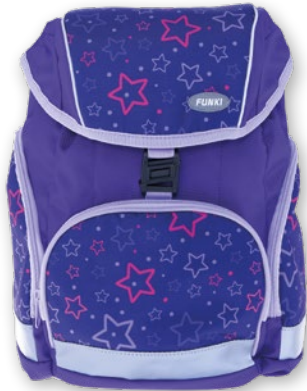
6013.008 Purple Stars