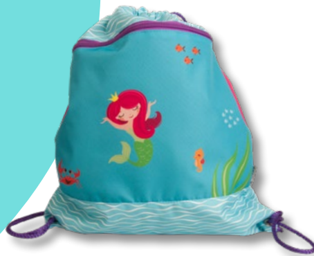
6030.020 Little Mermaid