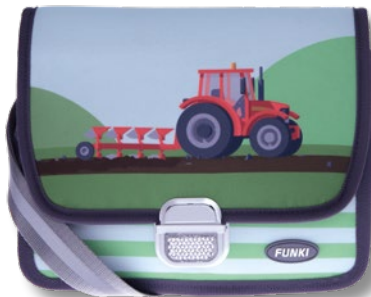
6020.035 Red Tractor