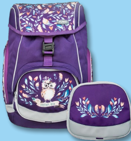
6040.608 Hippie Owl