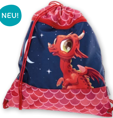
6030.040 Ruby Dragon