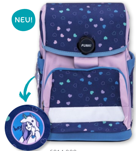
6014.009 Manga Girl