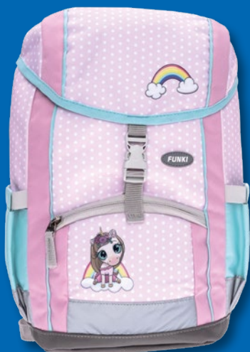
6025.001 Cute Unicorn