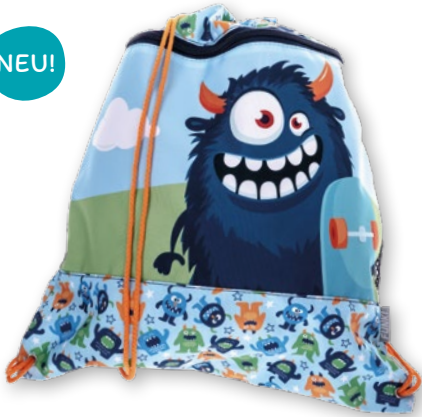
6030.041 Fluffy Monster