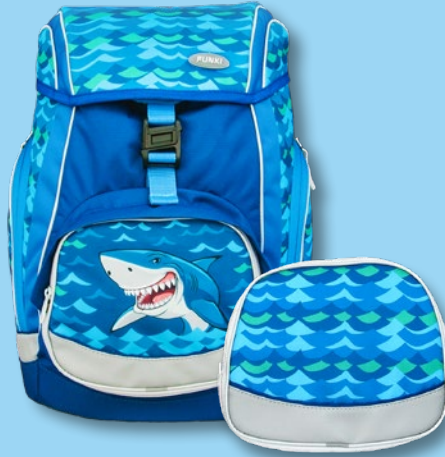
6040.606 Big Shark