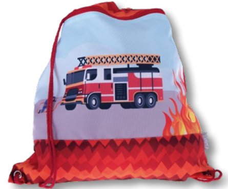
6030.034 Fire Alarm