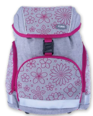
6013.007 Pink Flowers