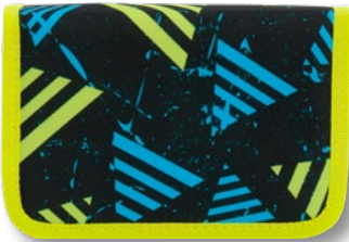
6012.005 Striped Triangles

Unsere beliebten FUNKI Schüleretuis bestehen aus robustem Textilgewebe und sind ausgestattet mit 18 Qualitäts-Farbstiften von Faber-Castell GRIP wasservermalbar, zwei Bleistiften Faber-Castell GRIP HB, einem Spitzer, Radiergummi, Lineal und einem Stundenplan in der Seitenklappe.