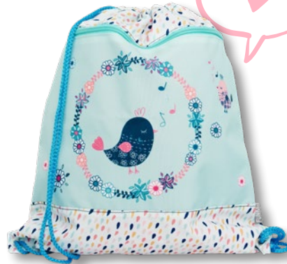
6030.029 Singing Bird