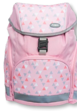
6013.002 Pink Triangle