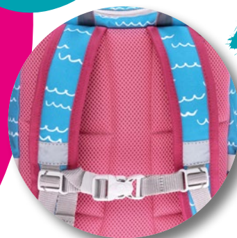
Ergonomisch geformter Rücken

Masse: 350×260×170mm Inhalt: 13 Liter Gewicht: ca. 380 Gramm